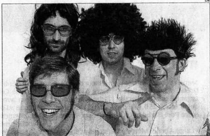
Le groupe Jaouen sera le 22 novembre à La Perle, rue du Port-au-Vin et le 24 novembre à l'Art-Scène rue du Château, à Nantes.

(1) La plaquette du programme est disponible dans des centaines de lieux publics ou sur www.bar-bars.com