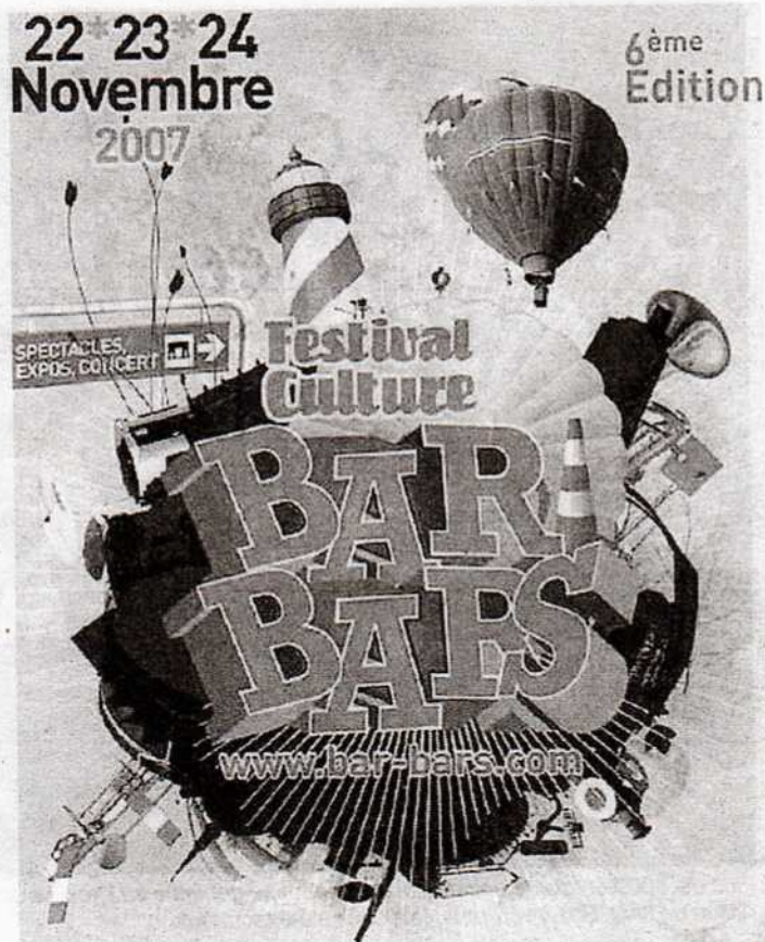
Bar Bars souhaite faire reconnaître le rôle local et garant d'un certain lien social que tiennent les nombreux bars.

Un bus nocturne et la possibilité de vous faire ramener à domicile sont même mis en place, et au final, la prévention aura représenté tout